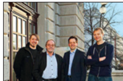
Unser Umweltteam